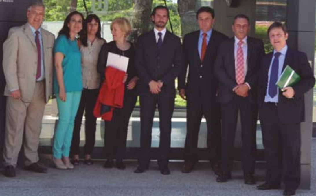
Staff directivo de CIP y Udima.